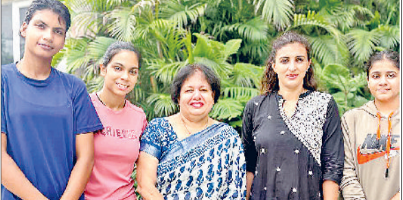
सोनीपत। पदक विजेता छात्राओं के साथ प्राचार्या एवं अन्य।