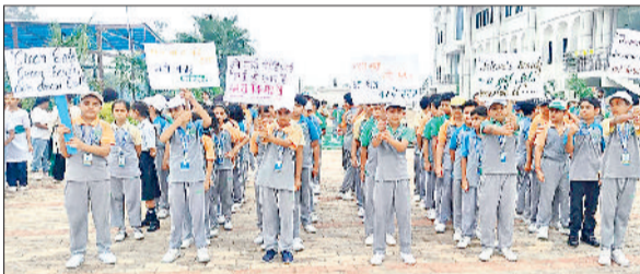
गोहाना। जागरूकता रैली निकालते नालंदा वल्ल स्कूल के विद्यार्थी।

गोहाना-जौद मार्ग स्थित नालंदा वल्ल स्कूल में शनिवार को वन महोत्सव मनाया गया। कार्यक्रम में विद्यार्थियों ने जागरूकता रैली निकाली और लघु नाटक प्रस्तुत करके पर्यावरण संरक्षण का संदेश दिया। इस कार्यक्रम में विद्यार्थियों ने अपने गुरुजनों के साथ विद्यालय परिसर में पौधारोपण किया और राहगीरों में भी पौधे वितरित किए। कार्यक्रम का मार्गदर्शन स्कूल