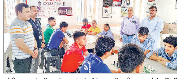
सोनीपत। शतरंज दिवस के शुभारंभ के मौके पर अधिकारीगण।

निदेशालय के निर्देशानुसार जिले के सभी सरकारी विद्यालयों में शनिवार को छात्र अभिभावक बैठक तथा शतरंज दिवस का आयोजन किया गया। जिसमें अभिभावकों व विद्यार्थियों ने बढ़-चढ़कर भाग लिया। सभी सरकारी विद्यालयों में शतरंज को बढ़ावा देने के लिए शतरंज दिवस के रूप में आयोजित किया जाना था। जिसमें सरकारी विद्यालयों में पढ़ने वाले विद्यार्थियों के लिए शतरंज खेलने