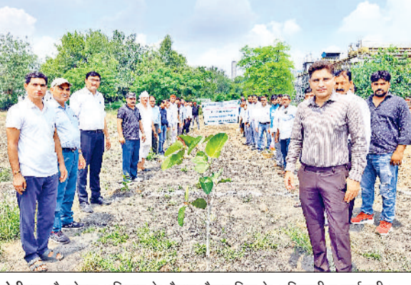
सोनीपत। पौधरोपण अभियान के दौरान मौजूद मिल के अधिकारी व कर्मचारी।

सोनीपत चीनी मिल परिसर में 'एक पेड़ मां के नाम' पौधरोपण अभियान की शुरुआत हुई। इस अभियान के तहत मिल प्रबंधन करीब 1000 पौधे लगाएगा। चीनी मिल के प्रबंध निदेशक (एमडी) ने पौधरोपण कर कार्यक्रम की शुरुआत की। पहले दिन प्रबंधन की तरफ से परिसर में हरे भरे व फलदार पौधे रोपित करने का कार्य किया गया है। पर्यावरण संरक्षण के प्रति जागरूकता इस अभियान का उद्देश्य पर्यावरण संरक्षण और हरित क्षेत्र बढ़ाने के लिए पौधरोपण करना है। साथ ही लोगों को पौधरोपण के महत्व के प्रति जागरूक करना भी है। एमडी ने कहा कि पौधरोपण से न केवल पर्यावरण को लाभ होगा, बल्कि आने वाली पीढ़ियों के लिए भी यह एक महत्वपूर्ण कदम होगा। कार्यक्रम में मिल के अधिकारी और कर्मचारी मौजूद रहे। सभी ने