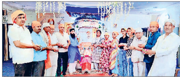
गोहाना। लखी बंगारा के चित्र पर पुष्प अर्पित करके श्रद्धांजलि देते नागरिक।