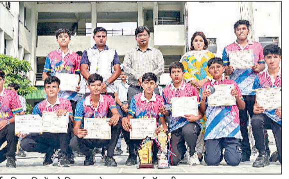
खरखोदा। सड़क निर्माण करते हुए लोक निर्माण विभाग।

प्रधानाचार्य ने खिलाड़ियों को मेहनत, समर्पण और खेल भावना की सराहना करते हुए कहा कि यह उपलब्धि उनके कठिन परिश्रम का परिणाम है। विद्यालय में खिलाड़ियों के कोच का भी आभार व्यक्त