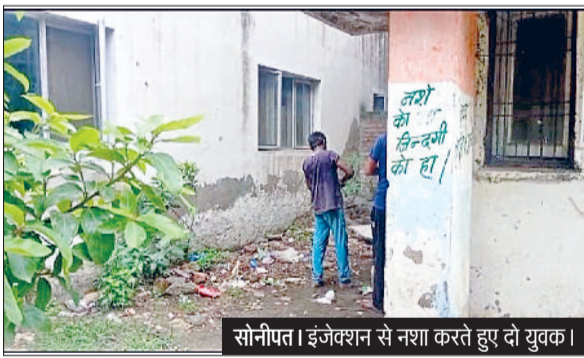
सोनीपत। इंजेक्शन से नशा करते हुए दो युवक।

नशेड़ियों की समस्या गंभीर नशेड़ी अस्पताल परिसर में खुलेआम नशा कर रहे हैं और उन्हें पुलिस और अस्पताल प्रशासन का