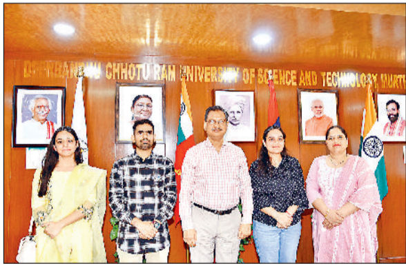
सोनीपत। डीसीआरयूसटी, मुखल कुलमुरु के साथ पीएचडी के पात्र शोधार्थी।