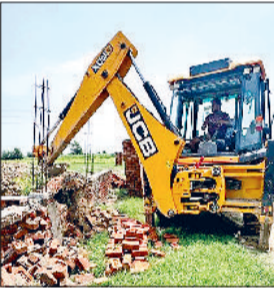
गन्नीौर। गढ़ी केसरी में अवैध कालोनियों पर हुए निर्माण को ध्वस्त करती जेसीबी।

जिला नगर योजनाकार अजमेर सिंह के नेतृत्व में प्रशासन ने गांव गढ़ी केसरी की राजस्व सीमा में अवैध रूप से बन रही कालोनियों पर बड़ी कार्रवाई की। शुक्रवार को सुरक्षा इन्फोर्स् के सामने करीब 5 एकड़ भूमि पर विकसित की जा रही 11 डीपीसी और एक बाउंड्री वाल की ध्वस्त कर दिया गया। यह कार्रवाई उपायुक्त के निर्देश पर अवैध कालोनियों को पनपने से पहले ही खत्म करने के अभियान के तहत की गई। जिला नगर योजनाकार अजमेर