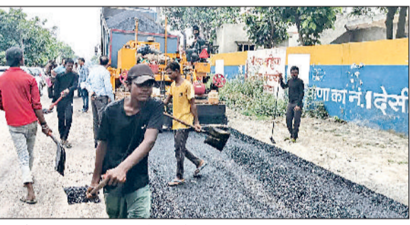
खरखोदा। सड़क निर्माण करते हुए लोक निर्माण विभाग।

किया, जिनके मार्गदर्शन में यह सफलता संभव हो पाई। विद्यालय भविष्य में भी विद्यालय भा विद्यार्थियों को खेल एवं शिक्षा दोनों क्षेत्रों में उत्कृष्टता। प्राप्त करने के लिए निरंतर प्रोत्साहित करता रहेगा।